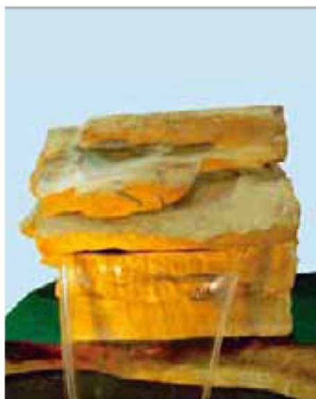
Декоративный камень для излива большого шириной 38,0 см арт. SG-80